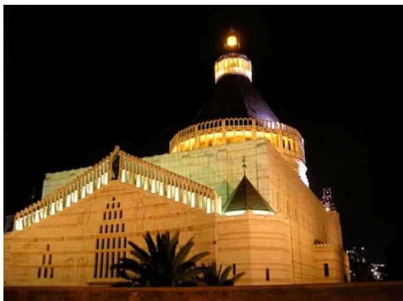
Basilica giubilare dell'Annunciazione Nazareth