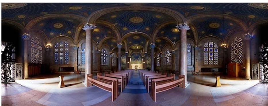
Basilica giubilare del Getsemani Gerusalemme

Vogliamo camminare su questa terra per invocare pace, riconciliazione, compassione e fedeltà al Dio della misericordia che tutti invociamo.